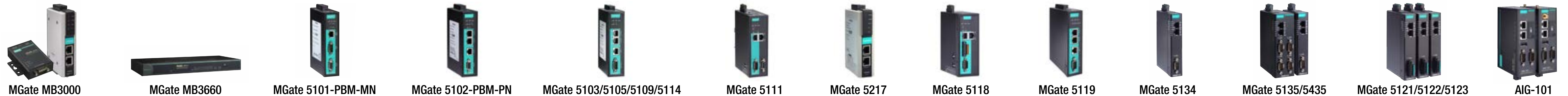
MGate MB3000 MGate MB3660 MGate 5101-PBM-MN MGate 5102-PBM-PN MGate 5103/5105/5109/5114 MGate 5111 MGate 5217 MGate 5118 MGate 5119 MGate 5134 MGate 5135/5435 MGate 5121/5122/5123 AIG-101